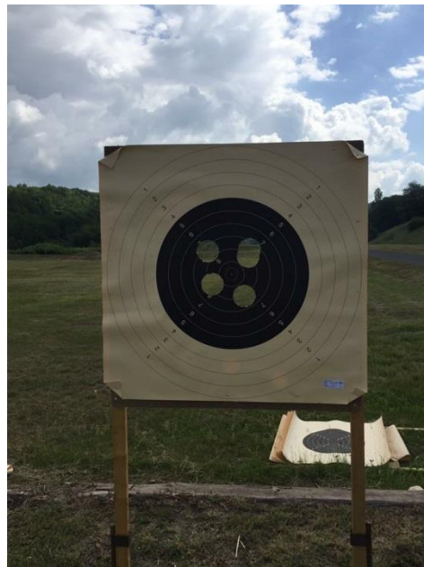
Na geht doch!