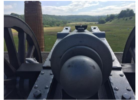
Guggen wo er hin muß