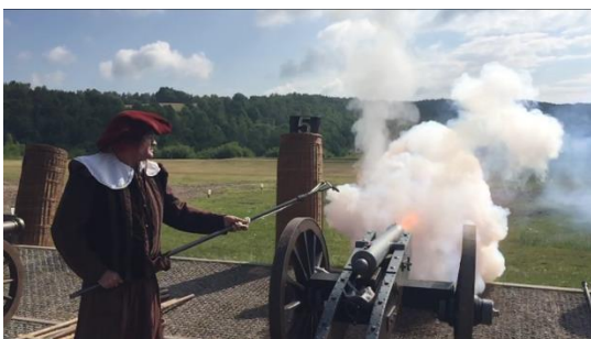
Nanu - schon fertsch