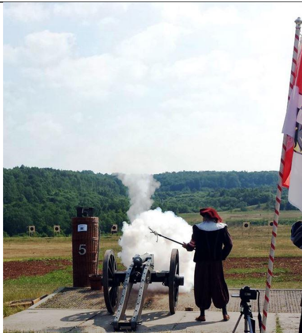
Auch Volker Grabow kann es noch !