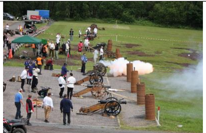
Ohne Worte !