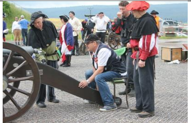
Erlaubte Hilfsmittel !