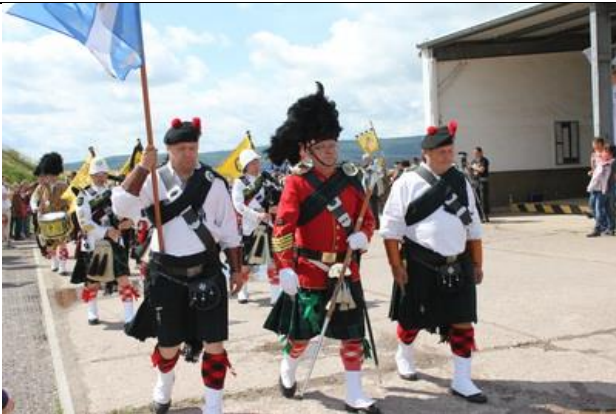
Einmarsch der Teilnehmer