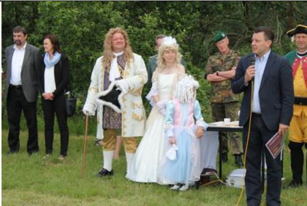
August der Starke