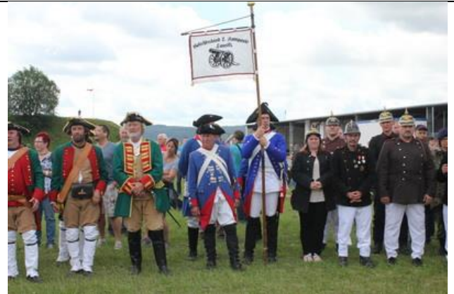
Sachsen, Preußen & die Feuerwehr